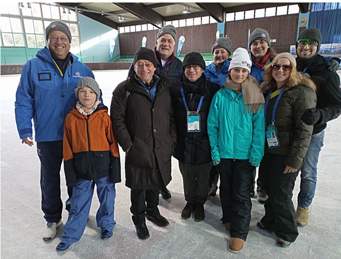
Amerikanische und Österreichische Stocksportler mit einem Dolmetscher, 3 von links.

Die nächsten Makkabi Winter Games werden vom amerikanischen Makkabi Verband ausgerichtet, diese finden in Sun Valley, Idaho statt.