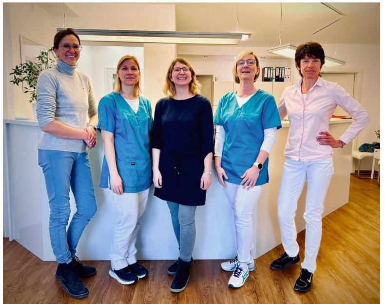
Von rechts nach links: